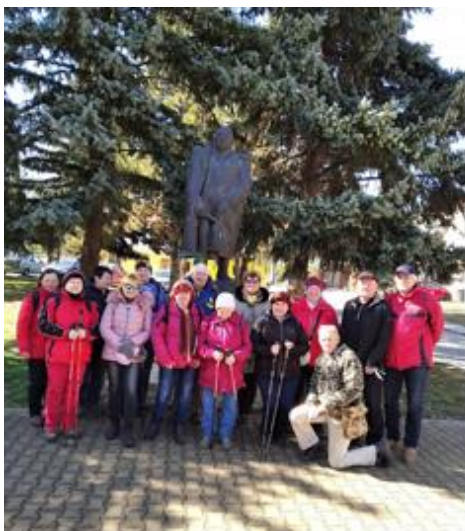
V Křenovicích s generálem