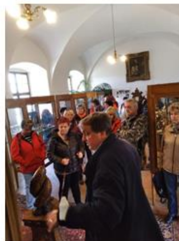
V Památníku písemnictví