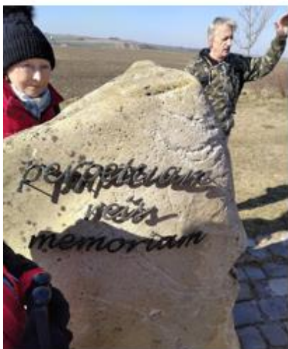
Na Šibeničním vrchu