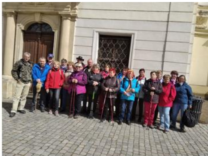
Výletníci v Rajhradě